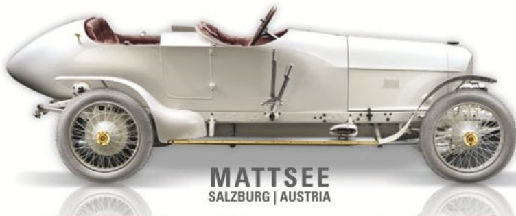
MATTSEE SALZBURG | AUSTRIA

Österreichische Automobilgeschichte und historische Flugzeuge auf 3.500 m 2